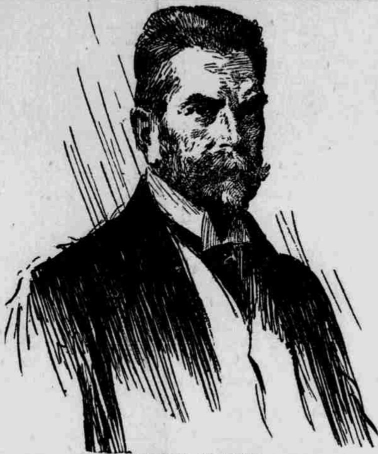
DR. KAREL KRAMÁŘ,