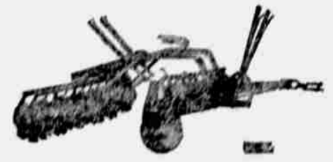
Oliver kotoučové brány pro traktor

To je druh pluhu, který všichni traktoristé hle při demonstrování ve Fremont. Můžeme naši objednávku ihned vyplnit, s jakýmkoli vzorem spodka pro každý druh pozemku. Máme na skladě každý druh buřt dvojn. tří neb čtyř radlicové — a 14 palců. Těž máme na skladě dvojn. neb tříradlicové a 12 palců.