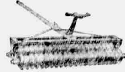
Oliver válcový pulverizer.

Po zoraní, kotoučové brány jsou následující důležitostí pro každého farmera. Máme hojnost těchto 40x36 desetinapových, jež po několik dní vydrží. Popište si s obvyklými kotoučových bran, ježto záoba jest obnovená a rychle obývá.