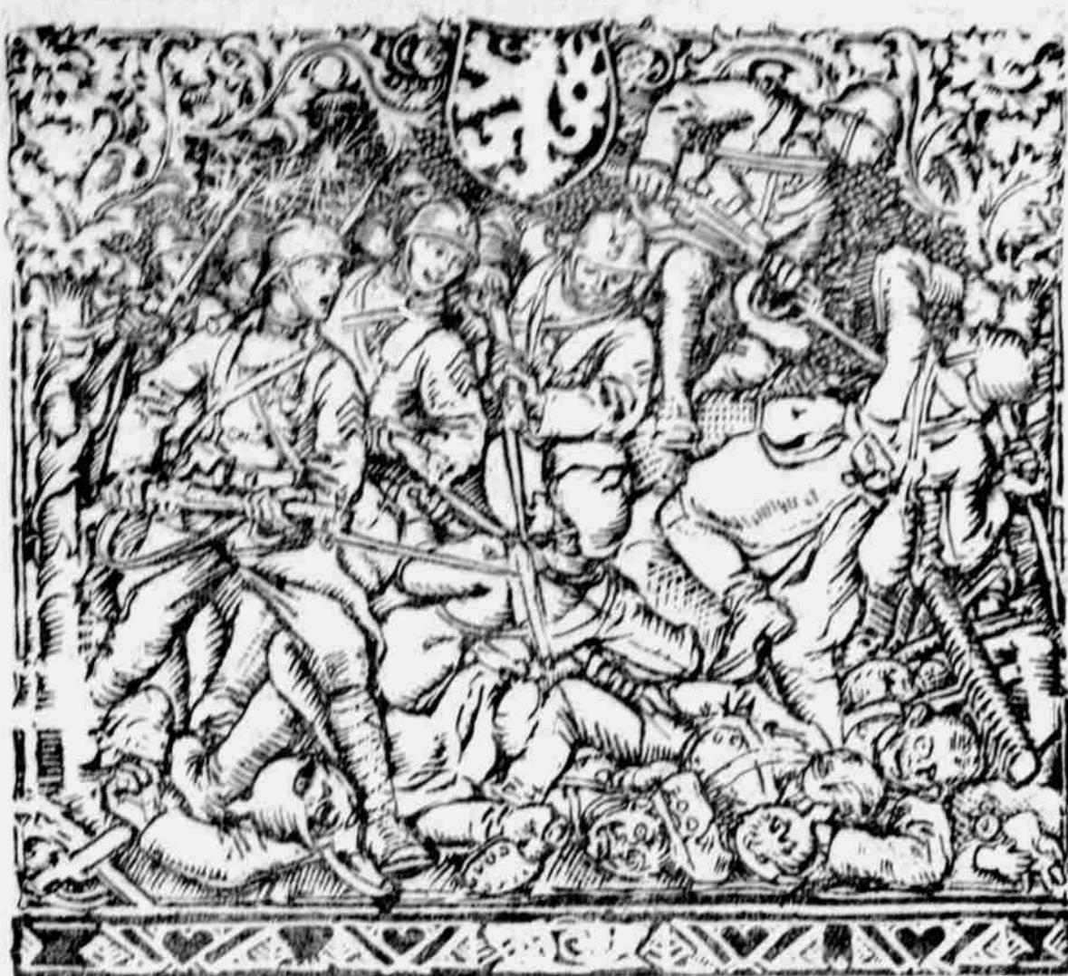
Nasi rekové — skuteční rytíři cti a práva — dobrovolníci česko-slovenské armády ve Francii.