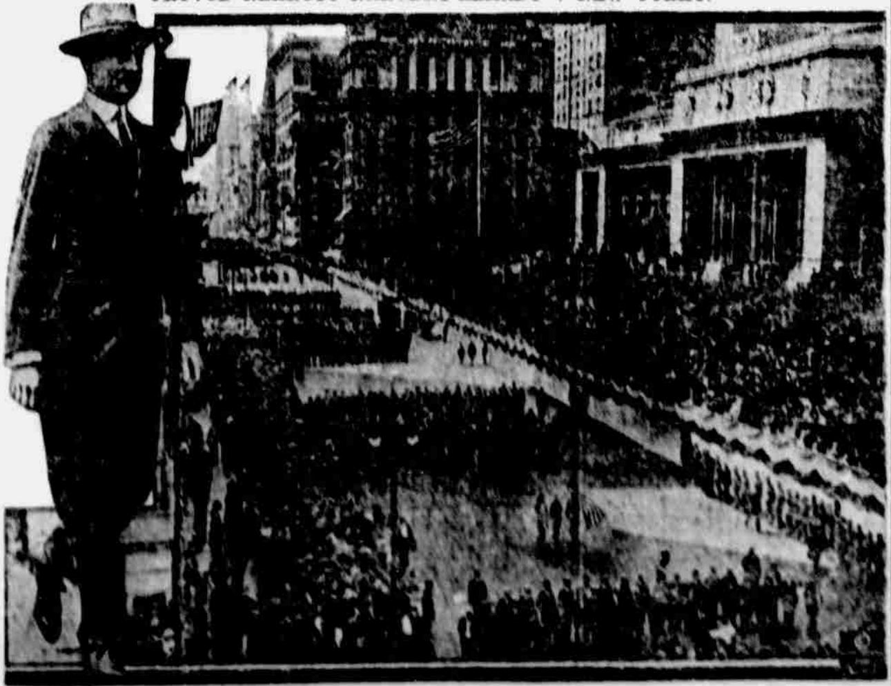
Průvod na rozloučenou rekrutů národní armády z New Yorku. Obrázek náš zachycen byl na Páté avenue a čtyřicáté druhé ulici. Na levo nalozá se mayor Mitchell, který pochodoval s vojny.