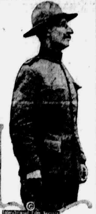
Plukovník Henry T. Allen byl povýšen do hodnosti brigádního generála a ustanoven k doprovázení vojsk generála Pershinga do Evropy jako jeden z jeho velitelů.

čádně k nejtěžšímu úkolu muže, k manželství a oteovství, ať nemluví o lásee k vlasti. Hospoda ubíjí vaše zdraví, lupí z vašich rukou peníze, jejich byste mohli jinak užítí, vrhá vás do dluhů, brání vám v práci, trísá blátem vaši čest, zneškodňuje vaše lásky, nedovoluje vám, abyste milovali svůj národ skutkem, činí z vás zrůdce národa. Chcete-li o sobě říci právem, že milujete národ, vzdějte se piva i vína, vzdějte se tabáku, buďte abstinenty!