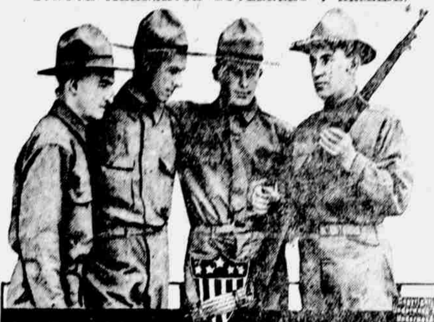
Na obrázku našem spatřujeme čtyři syny bývalých anebo přítomných guvernérů jižních států v důstojnickém výcvičním táboře ve Fort MacPherson, Georgia.