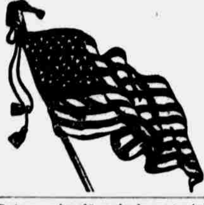
Boje na západě rozhodnou trvání války.

Washington, D. C., 27. května. — Italie vzdala čest Americe a prvnímu jejímu prezidentu dnes, když italská válečná komise učinila pouť do Mount Vernon a položila na hrobku George Washingtona bronzy věnce, kterými od dah starého Říma zdobení byli slavní hrdinové. Americkou komisi na této pouť doprovázela družina vynikajících amerických úředníků. Kniže Udine a senátor Marconi promluvili u hrobky anglicky a vzdali čest prvnímu prezidentu, stejně jako přítomným snahám Spojených Států ve válce.