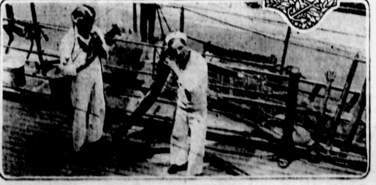
Američtí námorníci na palubě lodi ukazují, jak získávají jsou rozkazy během bitvy od důstojníků, nalézajících se v dolejších místnostech.