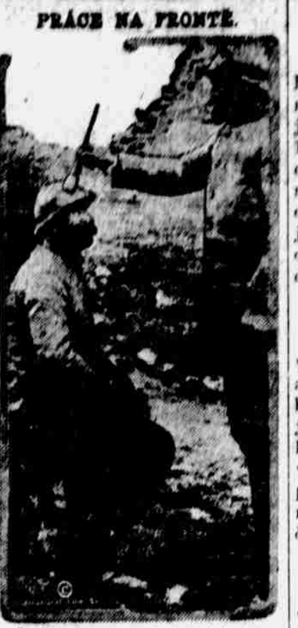
PRÁCE NA FRONTĚ. Sedlá barva na helmích francouzských vojáků potřebuje častého obnovení a na obrázku nashem spatřujeme francouzského vojáka, barvícího helmici svého kamaráda.