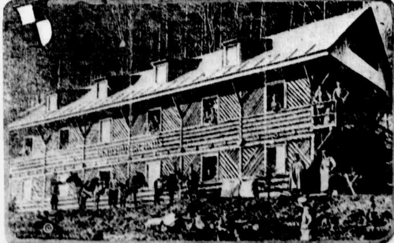
Tento velký srub, důkladně zhotovený a pohodlný, je jedním z mnohých, které zbudovány byly Němci na západní frontě v přípravě pro zimní kampaň.