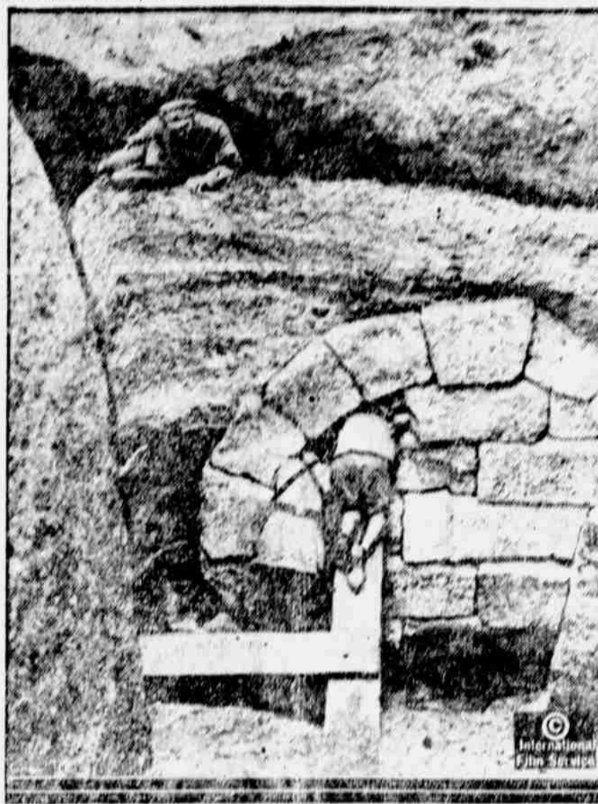
Na obrázku našim spatřujeme, anglické vojáky, prohlížející si rozbité katakomby na frontě na Balkáně, jež otevřeny byly výbuchem střely.

ské pevnosti. Poněvadž Němeči byli rozhodnutí docílit vítězství na západě, Rusové byli schopni zničit 100.000 rakouských a německých zajatců a 10.000 střevců, kteří nebyli zraněni. Důležité bylo pak schopni získati Gornel. Koncem pak Růmnicko, základna ruských vítězství, vystoupilo do války a zadrželo velkou německou armádu, která byla určena proti Rusku.