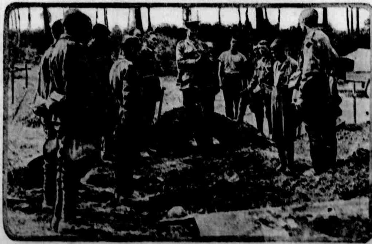
Tato úřední fotografie, zhotovená při nedávném postupu spojených na západní frontě, znázorňuje pohřeb Australcana, usmrceného v bitvě. Australská a Novo-zélandská vojska, která bojovala chrbtě na Galipolském poloostrově, osvědčila se znamenitě také na západní frontě.