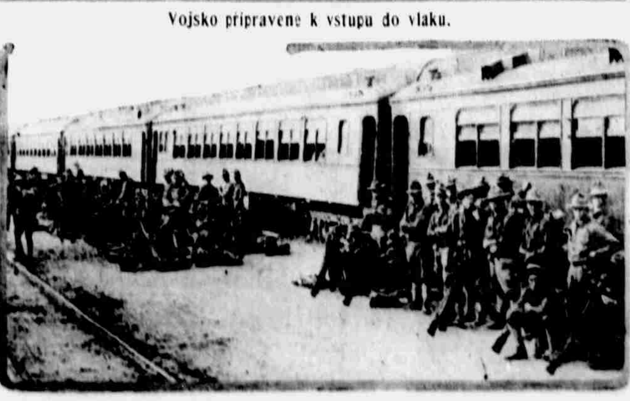
Vojsko připraveno k vstupu do vlaku.

Z Tarpon Springs dopravují se houby hlavně do New Yorku, Chicaga a Cincinnati, kde jsou bilyny, čerstvé a připravovány pro obchod v malém.