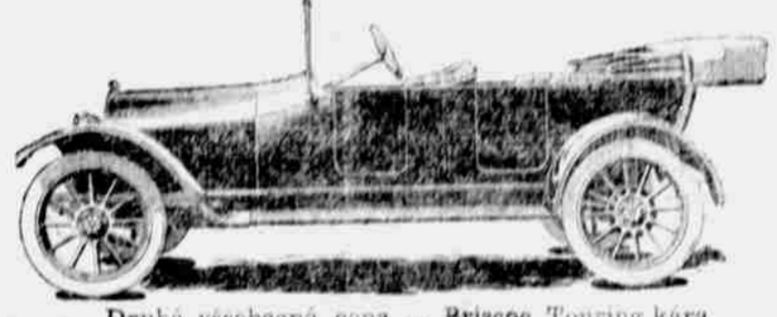
Druhá všeobecná cena — Briscoe Touring kára