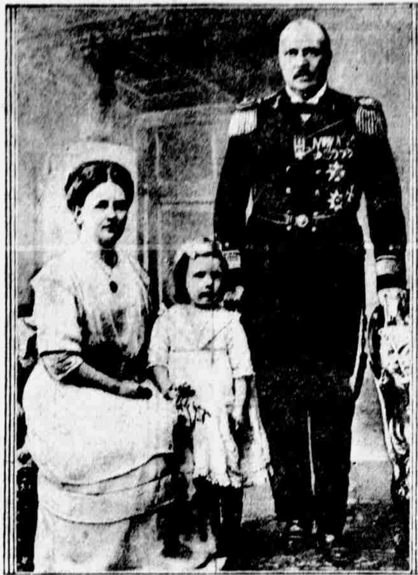
Evropa je plně zaměstnána usazováním, jaké bude stanovisko Holandska v budoucnosti. Na obrázku našem spatřujeme královnu holandskou Vilemínu, jejího manžela, prince Henryho, a jejich děti, princeznu Julianu.

viděla tak opatrného a dobře plánovaného útoku. Berlín prohlásilo, že ztráty před Verdunem je možno považovati za normální. Francouzské odhady jsou prohlásovány za přehnané. Není ale o tom sporu, že německé ztráty byly větší, než německá válečná úradovna je ochotna připustiti. Němci ale počítají, že výbojem u Verdun podarí se jim docílit řady pozoruhodných výhod, které budou dostatečnou náhradou za utrpené ztráty. Podarí-li se Němcům uzavřiti úhel severovýchodně od St. Mihiel k Verdun, tak aby linie běžela přes St. Mihiel k poslední jmenovanému místu, bude třeba k obhajování této nové linie o 75,000 až 150,000 mužů méně, poučevadl patnáct míl bude uzavřeno. To by byl německý zisk. Německá obrana i ofenziva byla by značně zlepšena dobytím Verdun, i kdyby po té neudoboval žádný další úspěch, a Francouzové byli by nuceni vykliditi 4,000 čtvercch míl území východně od linie od Verdun k Epinalu k Svycarsku, Francouzské posice v Champagne byly by vážně ohroženy a Francouzové byli by nuceni ustoupiti sedmadvacet míl, aby srovnali linii se St. Menchould, následující pevností, západně od Verdun.