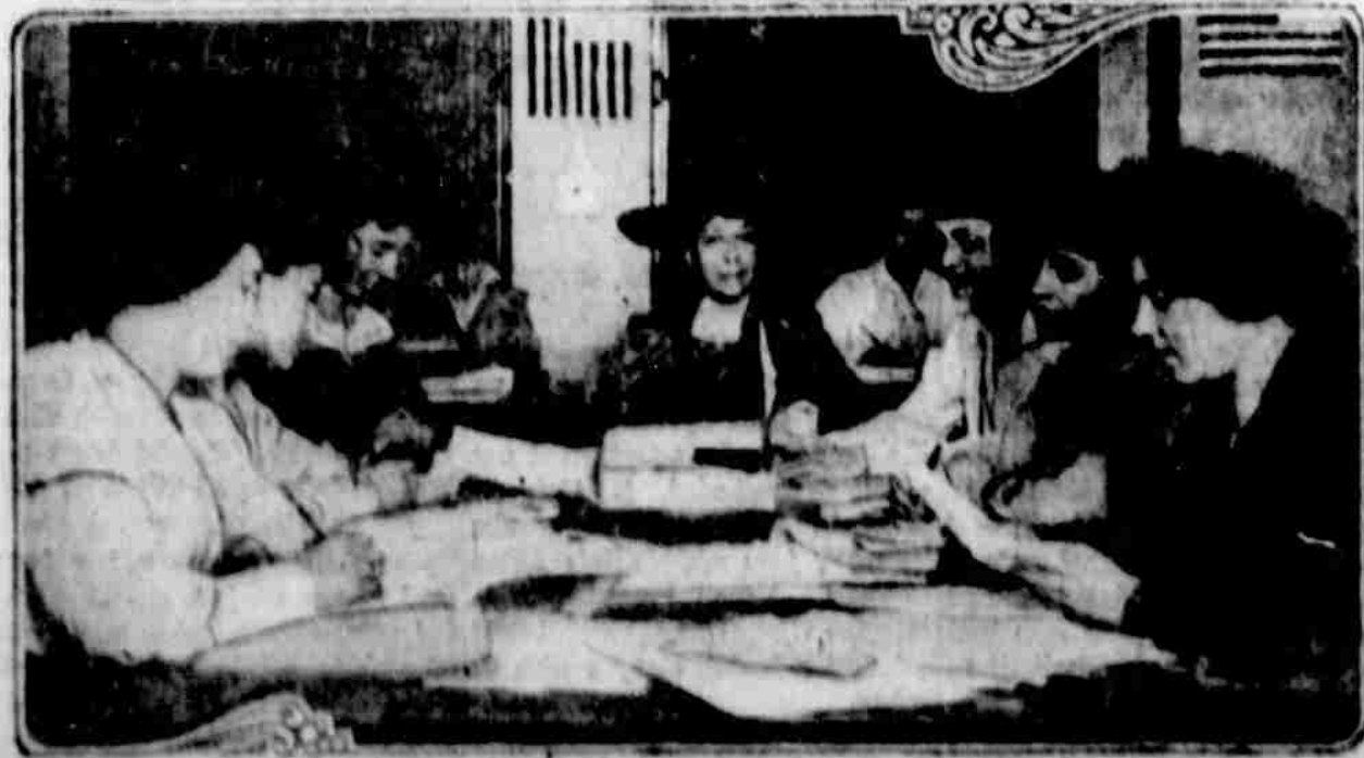
Paul Viljan C. Storyová, předsedka Dver Americké Revoluce řídí práci belgického pomocného výboru dne 8. dubna, kterýto den byl ustanoven této organizaci.