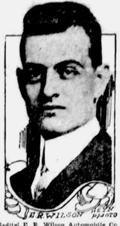
Reditel E. B. Wilson Automobile Co.

muž, kteří svoji odvahou a naději zadrželi příliv pochybovačnosti a strachu, která vyvala se na svoji škarohlídskou cestu přes naši zemi v srpnu roku 1914.