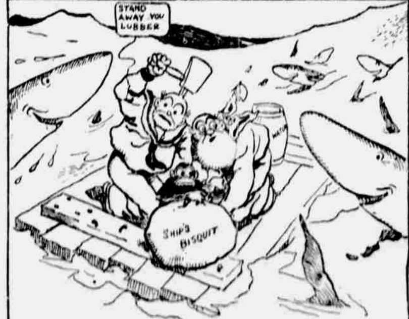
Arter driftin' out o' sight o' th' vessel on a sort o' raft th' se-gacious critter had rigged up, stove my sides if we didn't bump into a school o' man-eaters that 'us a caution, an' if Bill hain't brought along th' ship's ax, which he most generally always did, we'd a been swamped sartin.