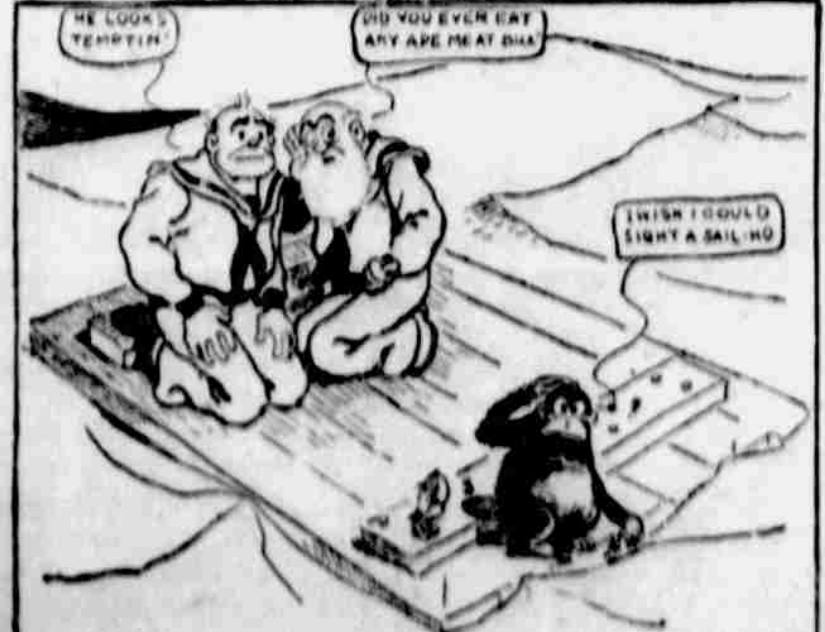
Arter three weeks 'ithout sightin' a sail th' supplies run out, an' poor Bill's mind begun to wander in his head. At mess-time he'd think o' th' crew safe an' snug on board th' Dancin' Sally an' say 'at Captain Soakum wusn't such a bad man at heart arter all, an' then he'd abuse that poor ape shameful.