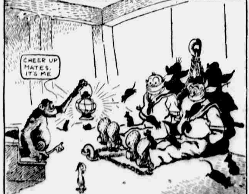
I never see th' master o' a craft take on as did this same Captain Soakum. It was sumpin' ter-rific t' see, but that night arter we'd been clapped in irons wot d'ye s'pose, if that ape o' Bill's didn't sneak down t' th' bulkhead there 'ith a lantern an' turned us loose.