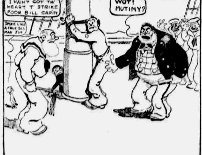
Man and boy, afore the mast, I've stood con-sid-er-able abuse in my time, but I'm no hand to complain, not me, but when Captain Soakum o' th' brig Dancin' Sally, ordered me t' lay twenty-nine stripes on my old mate Bill, I rebelled, I did, an' you can lay to that