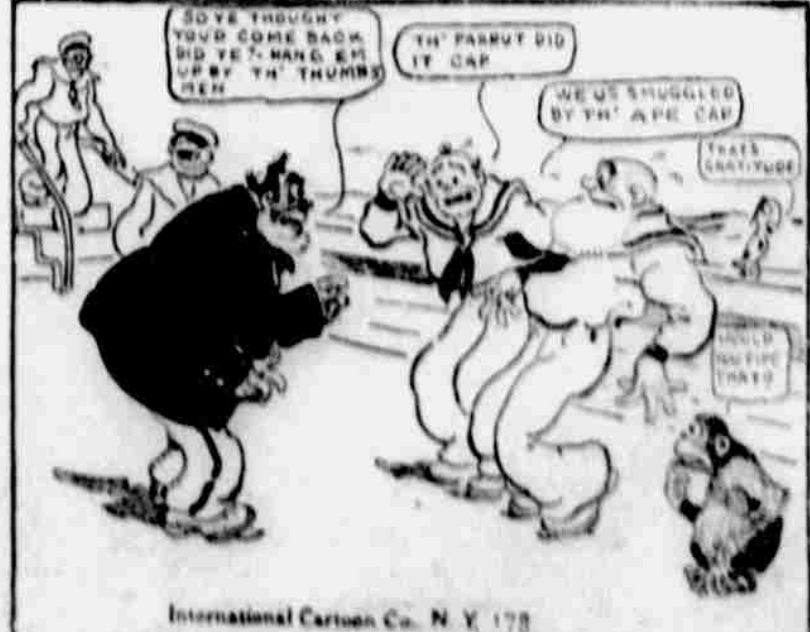
Well, sir, we 'us that glad t' get aboard 'at we never took our bearin's nor noticed the trim o' th' craft, an' blow me a breeze if it wusn't no more nor less than that same Dancin' Sally 'ith Captain Soakum in charge. Well, to wind up a long story short, Bill an' me wore stripes from that 'ape cap o' mine-tails for many a long day arter.