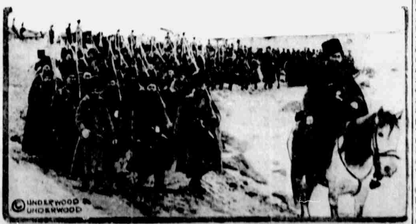
Obrázek tento zhotoven byl při ústi řeky Dunaje na rumunsko-ruském pomezí. Znamoňuje jeden oddíl ruského vojska, který bylo v Bessarabii shromažďováno, aby zahájilo postup na Bulharsko. Pozdější zprávy oznámily, že vojsko toto posláno bylo na hřebenů linii na hranicích Bessarabie, kde nyní útočí na rakouské linie.