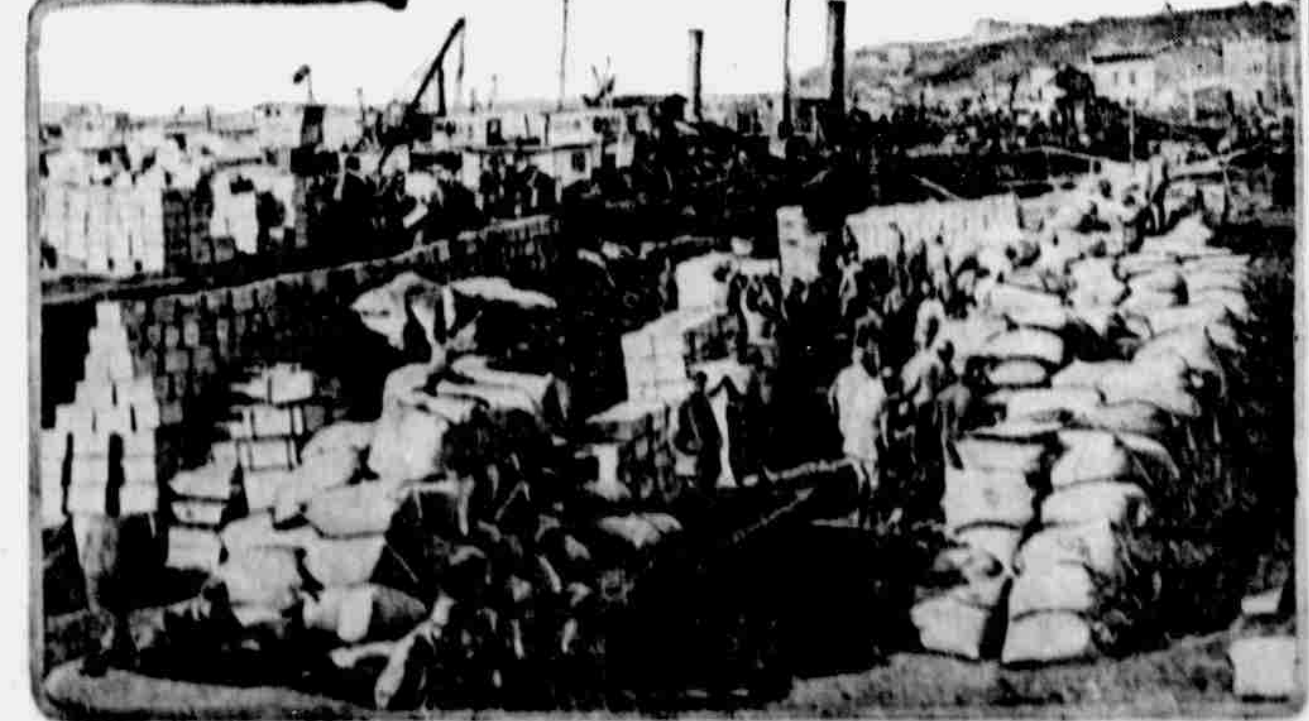
Tento obrazek je jedním z prvních, které zhotoveny byly v Bělehradě za jeho okupace Němei a ukazuje německé a rakouské vojáky v docích, připravujících k odeslání velkého množství váleč. materiálu do Cařihradu v Turecku.