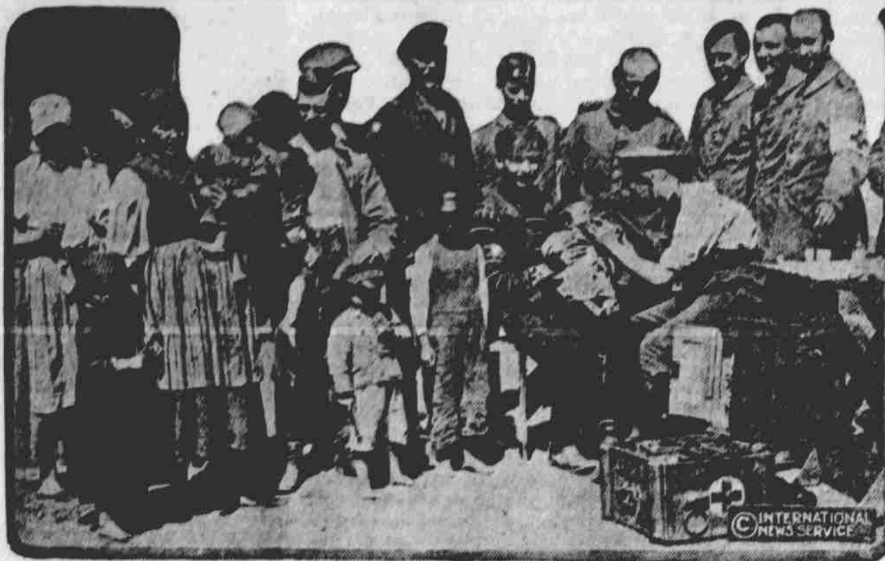
Po obsazení ruského Polska Němci bylo vyhlášeno, že němečtí armádní zubolékaři ošetří zdarma zuby polských venkovanů. Na obrázku našem spatřujeme, jak řada venkovanů polských použila této výhody.

Thurstonu a odtud do Swedeburgu, kde vloženi byli na vlak, jímž dopraveni byli do nemocnice v Lincoln k ošetření.