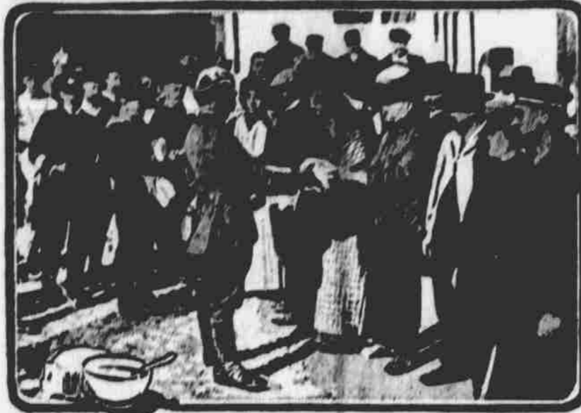
Scény, jako tato, odehrávají se ve všech městech belgických, avšak nebýti americké pomoci, bylo by to s Belgičany zle dopadlo.

slán se zlým úmyslem. Ku kabelogramu vřehu uvedení sděluje Spojený tisk z Chicaga: