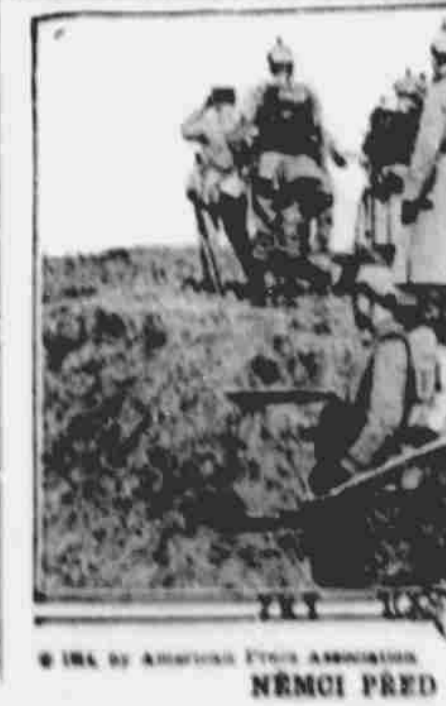
NĚMCI PŘED ANTVERPAMI.