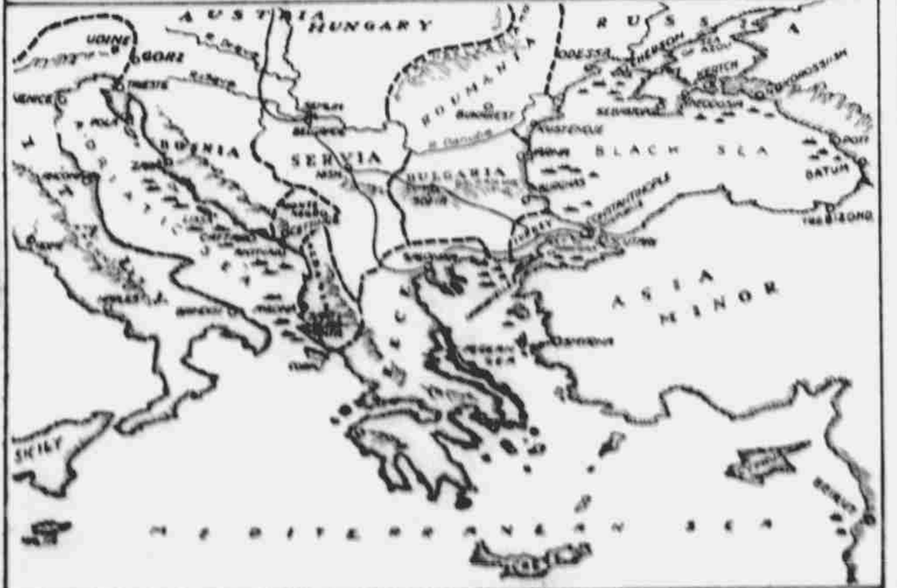
Turecko-tasillo zbraň proti Rusku a ostatním nepřátelům Německa. Hrubější mapa znázorňuje oblast Středoziemního a Černého moře, kam již válka zasáhla. Nejlepší tureckou válečnou loď jest Goeben, kterou "koupilo" od Německa. Obrázek Goebenu jest nahore.