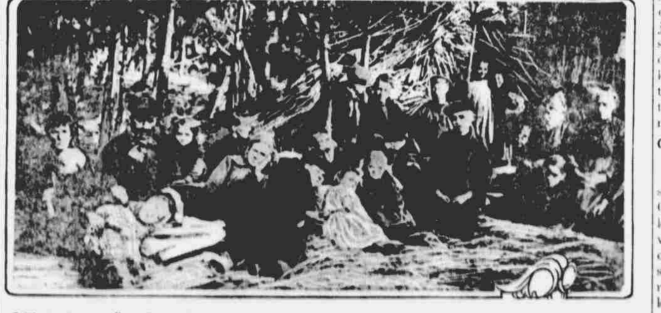
Z DOMOVŮ SVÝCH VYHNANÍ BELGICANĚ TÁBORÍCI V LESÍCH.