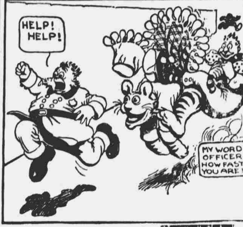
SIMON SIMPLE A BENGÁLSKÝ TYGR.