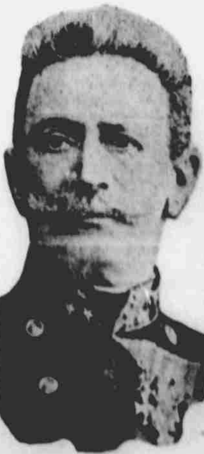
Jeden z velitelů německého vojska.