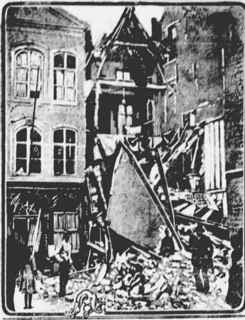
SPOUSTA ZPŮSOBENÁ DÉLŮVÝMI KOULEMI V MALINES, V BELGIJÍ.

V min. dnech přijelo do Stockholmu 6 lékařů a 24 ošetrovatelk amer. Červeného kříže na cestě do Petrohradu. Výprava odjede ze Stockholmu přes Raumo, švédonský přístav, odkud dopravena bude vlakem dále na své působiště. Švédský tisk jednohlasně chválí znamenitou organizaci americké kříže a obdivuje se jeho výtečným nemocničním pomůckám.