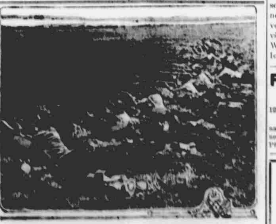
ŠKOTSTÍ VOJÁCI V ZAKOPRON.

Český právník. Úřadovna: č. 1325, roh 14. a William ulice OMAHA, NEBRASKA Telefon: Doug. 8397. —Vražejný totař—