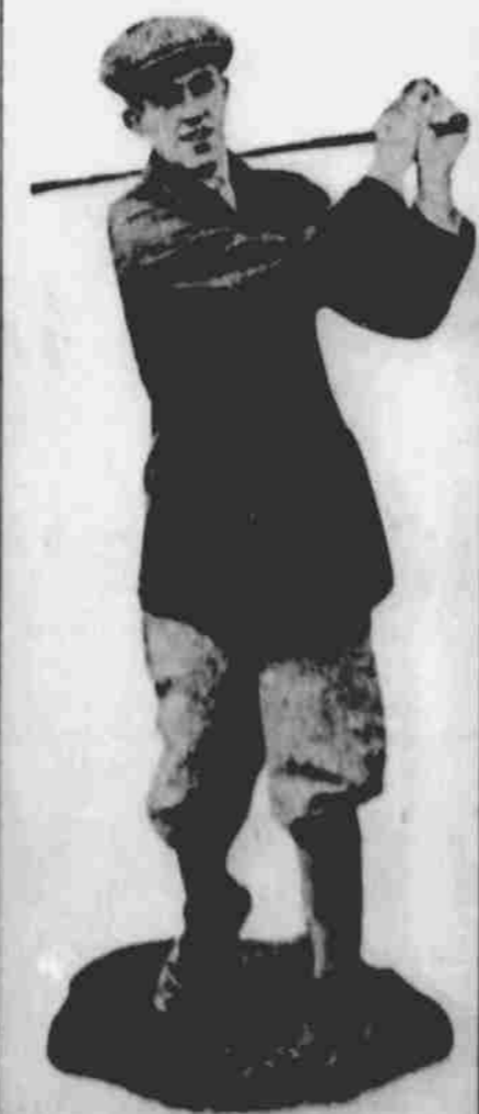
Týž získal americký championát ve hře golfu.