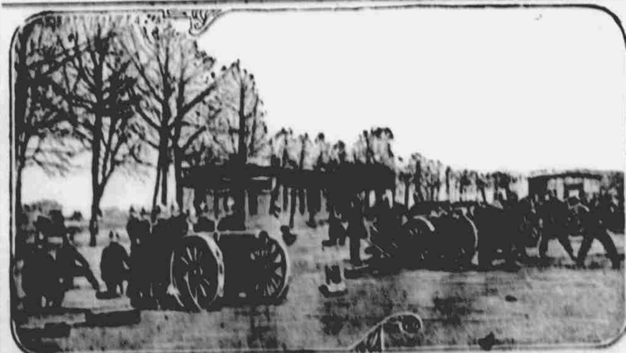
NĚMECKÉ DELOSTŘELECTVO V LUTICHU.

mír dá se udržeti jenom tehdy, když všechny země budu až po zuby ozbrojeny, ukázalo se nyní.