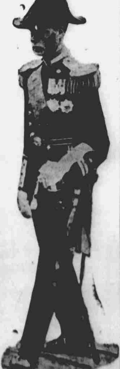
Prince Waleský jest poručíkem v gardě granátníků.