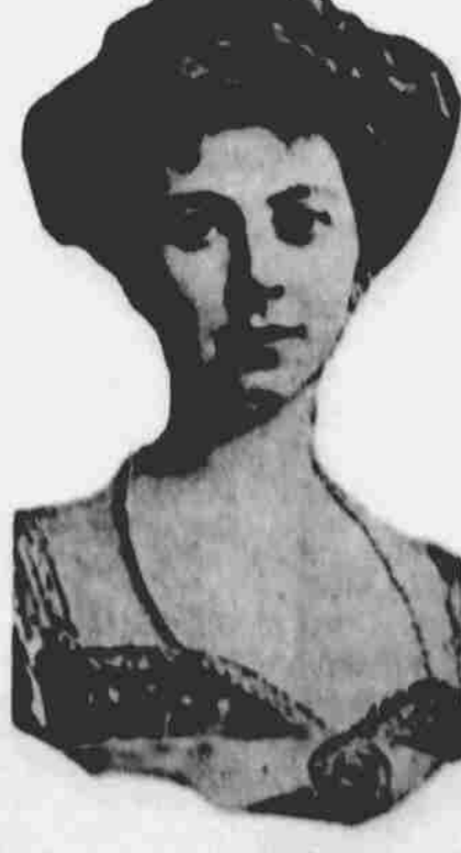
Bude hostem lorda Liptona při yachtových závodech.