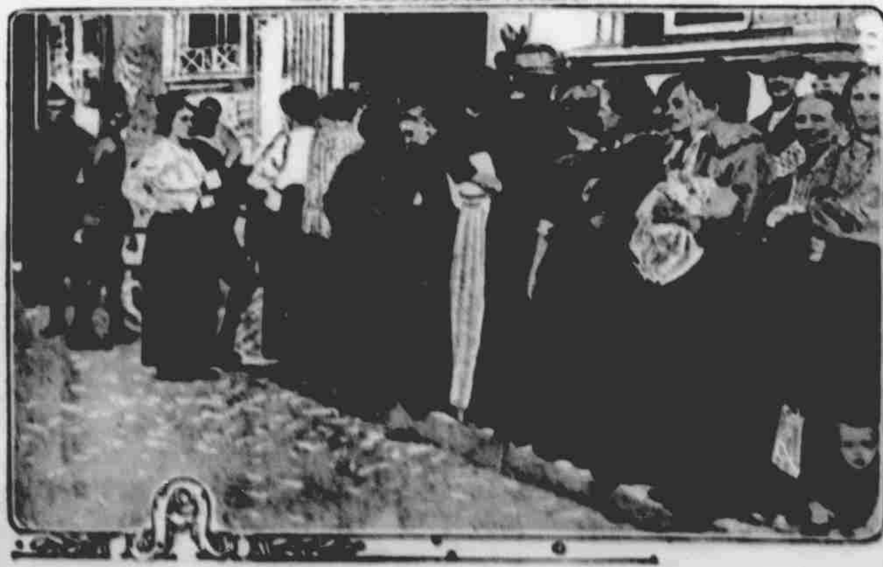
Přicházejí pro podporu 10 centů denně, kterou jim vláda vyplácí zatím co marně čekají na své vojáky.