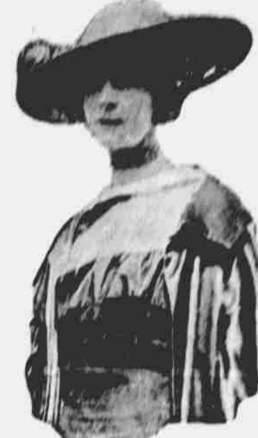
Nejposlednější fotografie vévodkyně meškající přítomně návštěvou ve Spoj. Státech.

hledy o tom, co stalo se evangeliem jejího života. Byla to spíše její železná vůle a odhodlání rozehvěti svět, které musíme obdivovati. Bez prostředků neb pověstí jako spisovatelka, mlčivě bez autority neb osobní zkušenosti, dovedla si najíti cestu k srdcím lidí. Je to všecko podivuhodný příklad, co za jedním cílem jdoucí osobou oddanou veliké věci může dokázati. Kdyby jenom několik tisíc takových, jako ona, věnovalo se a tímže nadšením věci míru, oš dále bychom byli. Při rozemě, baronka rychle ztratila zájem v pouhém nacionalismu a začala vystihovati internacionální jako pravý cíl osvíceného věku. Byl to smysl pro přibuzenství všech národů, který dik toval slova smid v posledním o sobním dopise přátelům v této zemi.