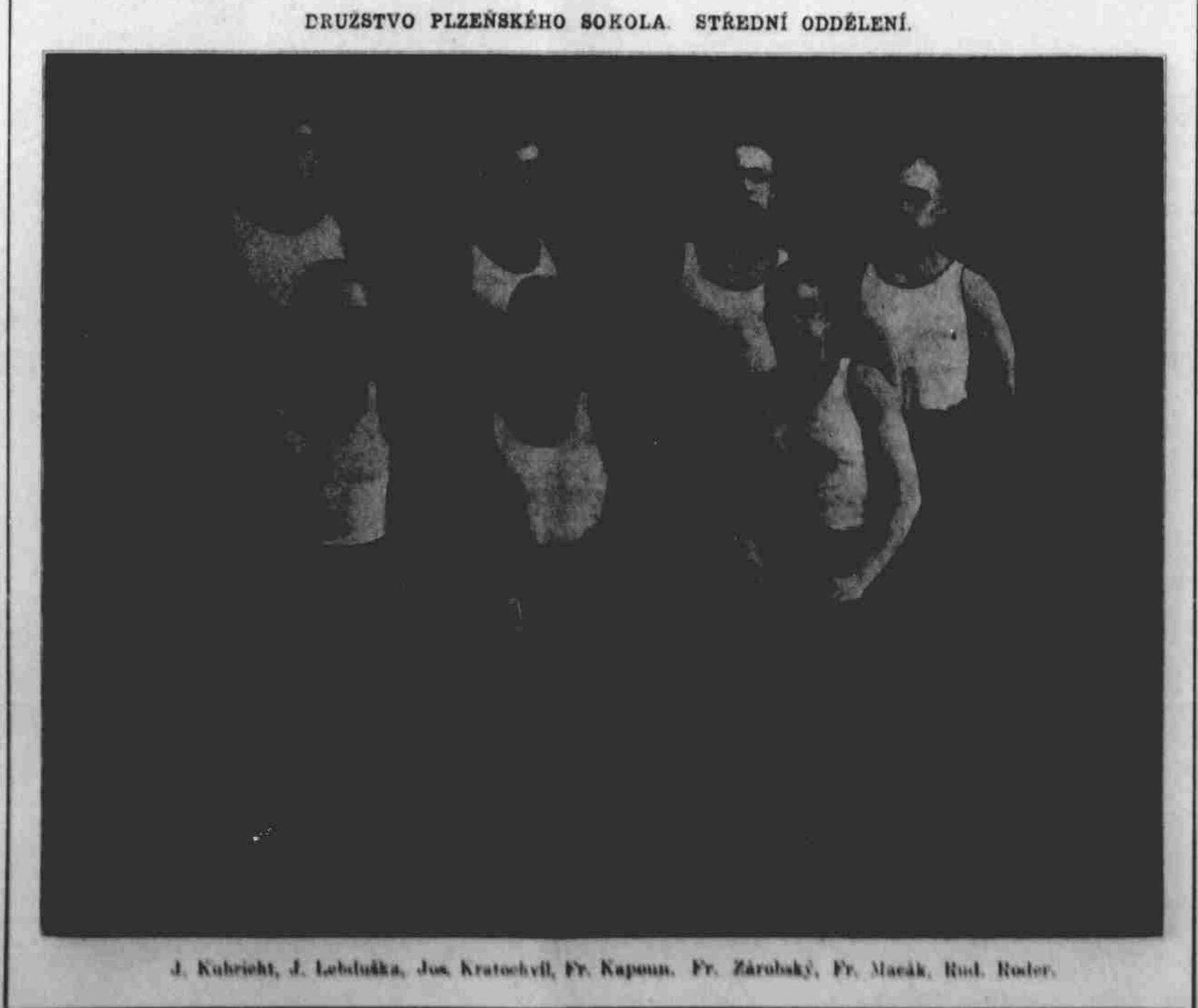
DRUZSTVO PLZEŇSKÉHO SOKOLA. STŘEDNÍ ODDĚLENÍ.

Nevstoupils v obyčejný spolek, vstoupil jsi v spolek sokolský, spolek bratrský. Bratrské ty té vítá. Avšak bylo by málo, kdyby pouze zájmeno té vítalo. Vítá té vřídlost, vítá té upřímnost, vítá té, kdokoli jsi, rovnost člověka důstojná. Ten dojem, tak žádat sniis, necht' všechno na tebe čini, když za člena té přijímají, když do družstva té vradují. Jsí v družstvu, evičitel ukazuje, vysvětluje, chrání. V tom ve všem ai značí se duch vskutku bratrský; necht' evičence vidí, že evičitel na správnosti, na usnadnění veškerých výkonů záleží, že pokrok, že bezpečnost svěřenců jeho, že všeobecné vzdělání tělesné za úkol sobě vytknul. On rozumným slovem, avšak i pevností o to se zasadí. Necht' domlouvá a nepovolí, když o zachování řádu neb rozvrhu se jedná; i v tom záleží pravý, až s počátku snad nedocela porozuměný prospěch a všestranný vývoj evičence jeho. M. Tyrš.