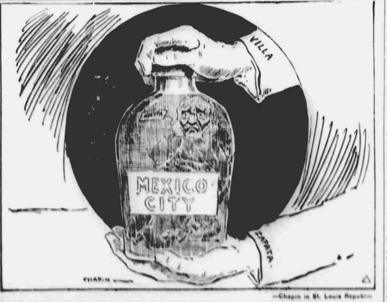
BAZÁTKOVAN — NIKOLI VŠAK DOBTI TRNĚ.