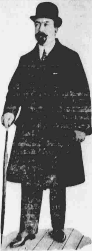
Nový prezident republiky Peru po vzbouření v zemi té.

Zásoba dnes ráno, ale Chicago oznámilo značnou dodávku a zdlouhavý stálý trh, tak že místní trh zahájen byl na stálém podkladě. Během dopoledne však, soutěž mezi vykrmovači dobytka a jatkaři přivádila sesazení cen na všechny druhy dobytka a při závěrku trh byl velmi živý a poslední prodeje zdály se býti o pět centů vyšší. Vezmeme-li trh celkem, hodnoty jsou stálé až o 5 centů vyšší, tak že povšechný trh byl o poznání vyšší, nežli v sobotu. Víceco bylo vyprodáno do 10 hodin. Prodeje byly ponejvíce mezi $8.55@8.60 a nejvyšší cena byla dosažena $8.70, která se rovná nejvyšší ceně, jež byla zaplacená až dosud tento rok.