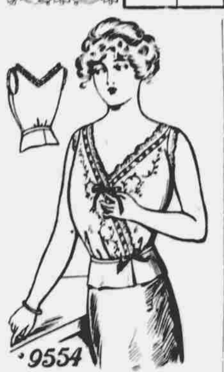
9554. Spodní živůtek (corset cover). Stříh v 6 velikostech: 32, 34, 36, 38, 40 a 42 palců přes prsa. Vyžaduje 1/4 yd. 36-palc. látky na 36-palc. velikost.