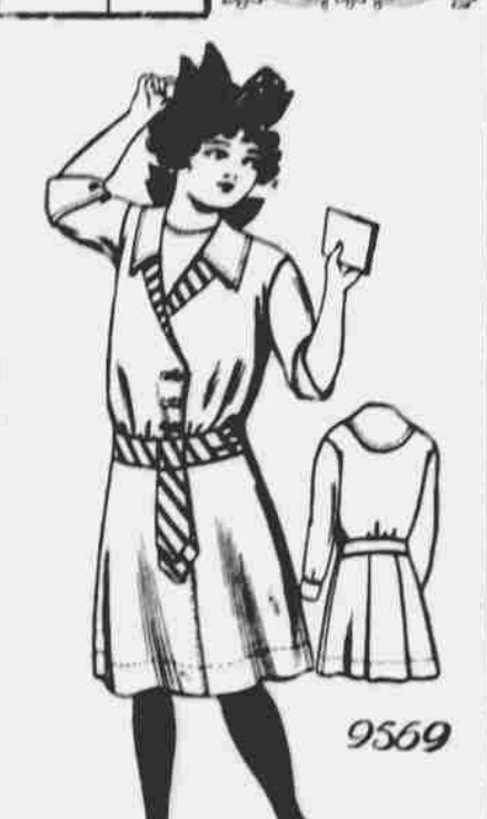
9569. — Šaty pro dívky. Stříh ve 4 velikostech: 8, 10, 12 a 14 roků. Zapotřebí 3/4 yardu 40-palcové látky na velikost 10 let.