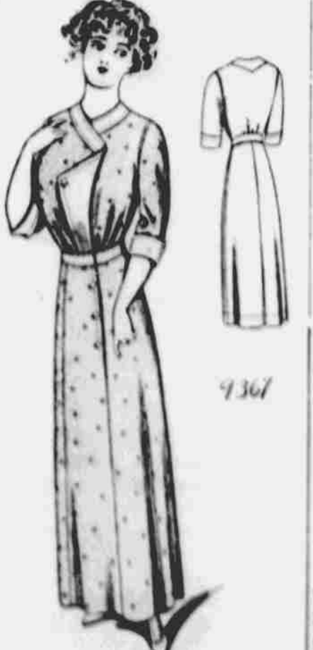
9367. — Domáci šaty pro dámy. Stříh v 6 velikostech: 32, 34, 36, 38, 40 a 42 palců přes prsa. Jest potřeba 5 1/2 yardu 44-palcové látky na 36-palcovou velikost.