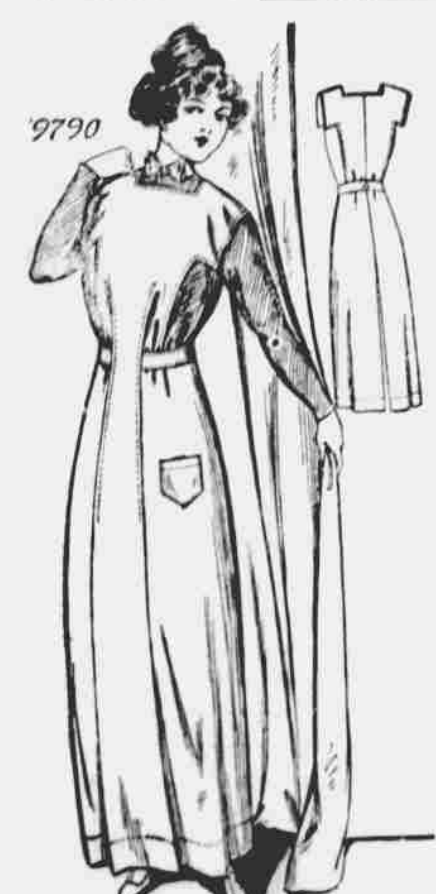
9790. Dámská zástěra. — Strih ve třech velikostech: Malá, prostřední a velká. Zapotřebí 4 3/4 yd. 36 pal. látky na prostřední velikost.