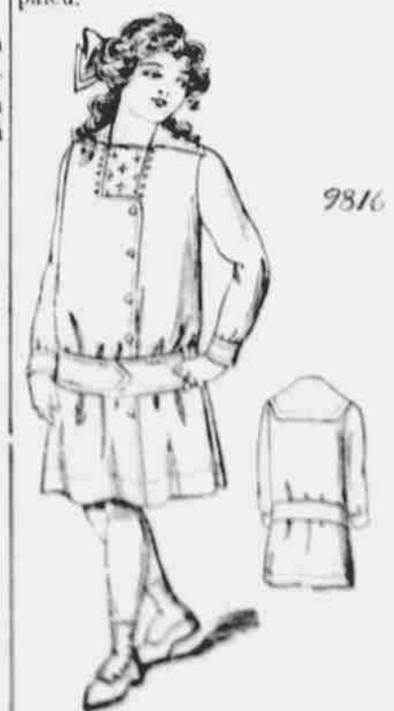
9816. Dívčí šaty. — Strih v pěti velikostech: Na 4, 6, 8, 10 a 12 roků. Vezmou 3 1/2 yd. 40 pal. látky na velikost 8 roků.

Upozorujeme naše odběratele, aby při objednávce vsorků strihů neopomenuli udati mimo naznačeného čísla ještě míru aneb stáří.