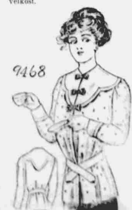
9468. Dámská jupička "Dressing sack". — Strih v šestí velikostech: 32, 34, 36, 38, 40 a 42 palců přes prsa. Zapotřebí 3 3/4 yd. 27 palcové látky na 36 pal. velikost.