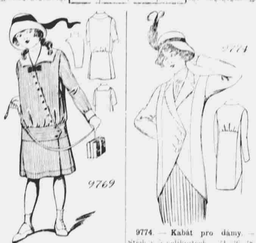
9769. — Dívčí oblek. — Strihá se ve 4 velikostech: pro 6, 8, 10 a 12 let. Je třeba 5 yardů 36 palevové látky pro 10 letou.