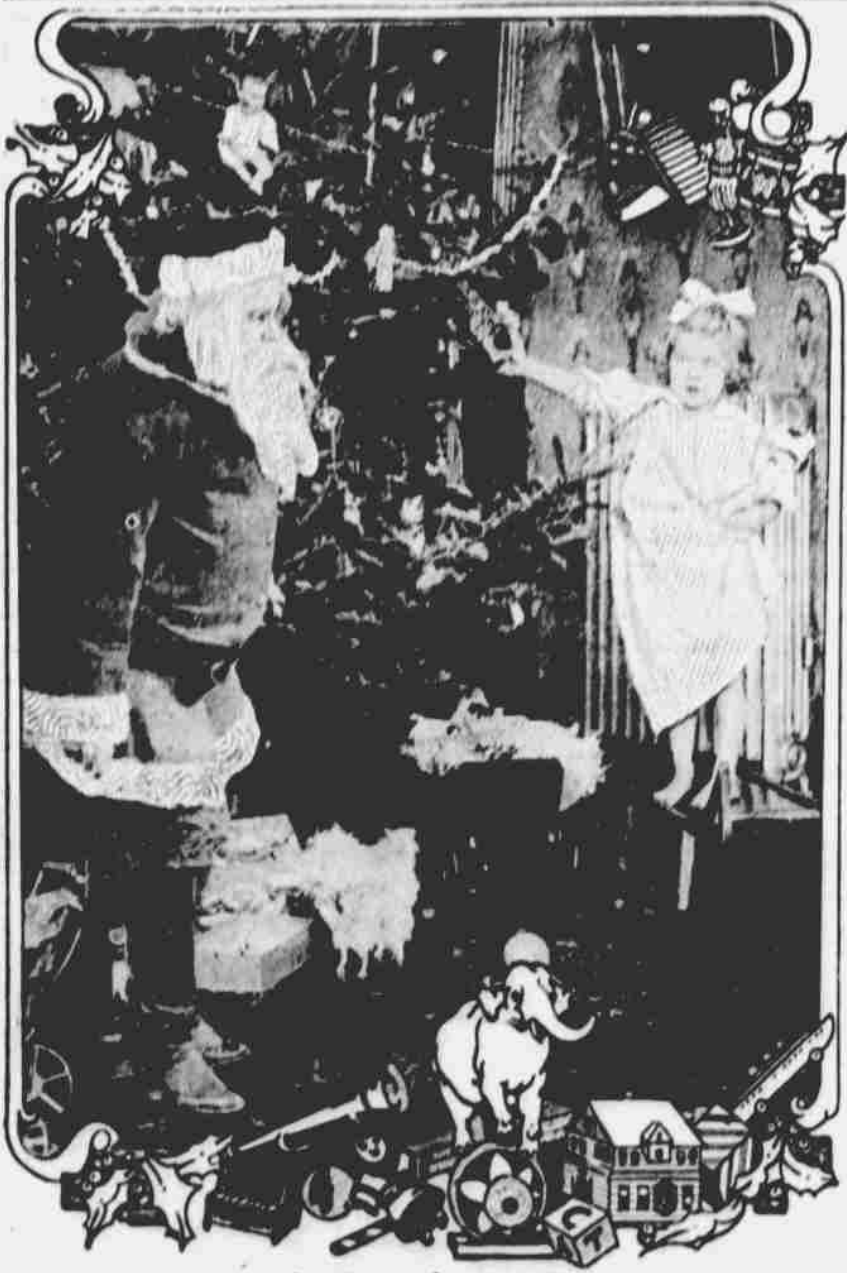
„JÁ TĚ VIDÍM, SANTA!“