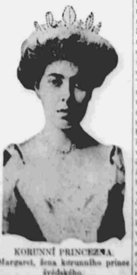
KORUNNÍ PRINCEZNA Margaret, lena korunního prince českého.