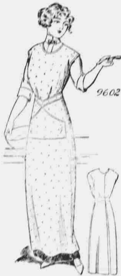
9602. Zástěra pro dámy. Střihy ve 3 velikostech: malé, střední a velké. Jest třeba 4 1/4 yardu 36-palcové látky pro střední velikost.