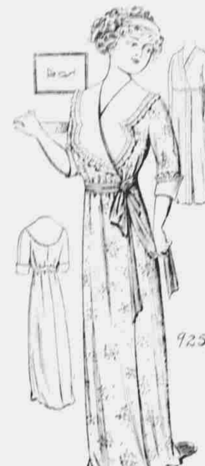
9259. Kimono pro dámy. Střihy ve 3 velikostech: Malé, střední a velké. Jest třeba 6 1/4 yardu 36-palcové látky pro velikost střední.