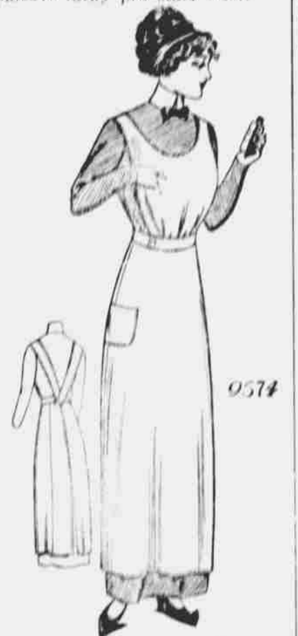
9574. Zástěra pro dámy. — Stříhy ve 3 velikostech: malé, střední a velké. Jest třeba 3 3/4 yardů 36-palcové látky pro střední velikost.