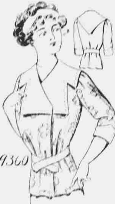
9360. Domácí živůtek pro dámy. — Stříhy ve 3 velikostech: malé, střední a velké. Jest třeba 3 1/2 yardů 27-palcové látky pro střední velikost.