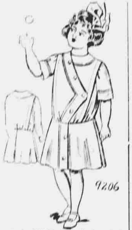
9206. Oblek pro dívky. — Stříhy ve 4 velikostech pro 6, 8, 10 a 12 let; jest třeba 3 3/4 yardů 40-palcové látky pro stáří 8 let.