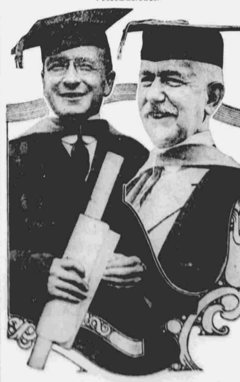
Oba dva mají dosti příčin, aby se usmívali. Byli velmi úspěšní ve svém podnikání, a universita Columbia právě udělila čestný stupeň doktora vědy každému z nich. Dr. Alexis Carrel z Rockefellerova Institutu, v New Yorku, jezd získal Nobelovu cenu pro bádaní v lékařské vědě, jest na levo. Druhým jest plukovník William Crawford Gorgas, příručí generální chirurg z lékařského armádního sboru Spojených států. On jest tím mužem, který zřetlil nad životu zmieni a jinými chorobami tokou druhu na Panamském pásmu.