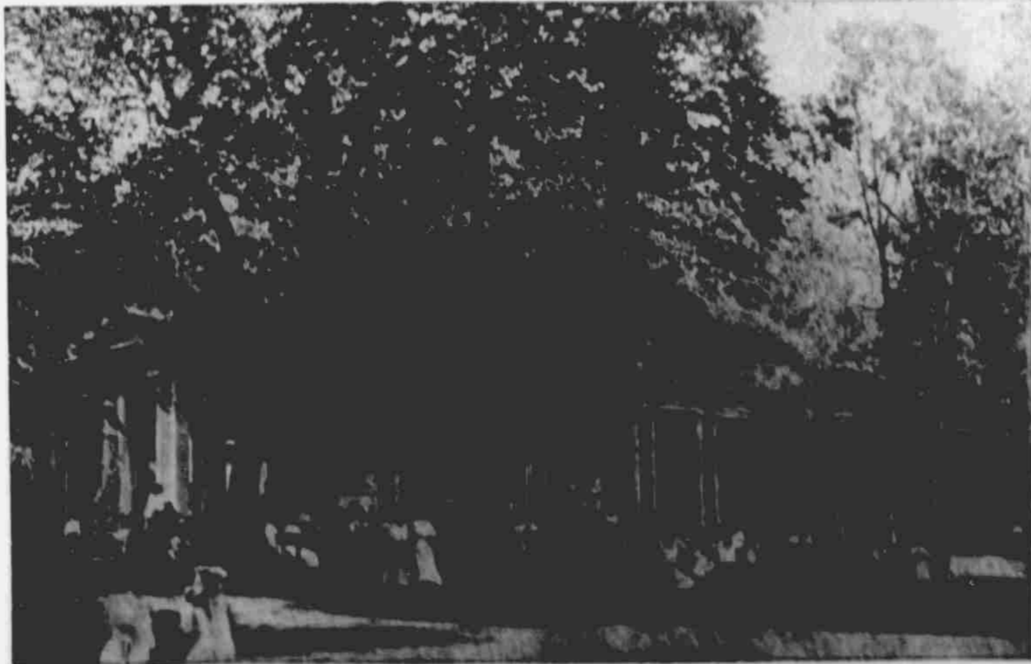
Riverview park v Omaze.

Pozemky tyto nalezají se podél dráhy uvedeně od North Platte do Gering. Městečka při této dráze téměř všude rostou. North Platte Valley má budoucnost a naši krajané by sobě nevěřili nechati ujíti tuto příležitost. Zde možno zařiti s malým kapitálem a dosáhnouti se skvělé budoucnosti. Jak jsme již uvedli, možno zde pěstovati vše s úspěchem lepší, než v západní Iowa ačeb ve východní Nebrasece.