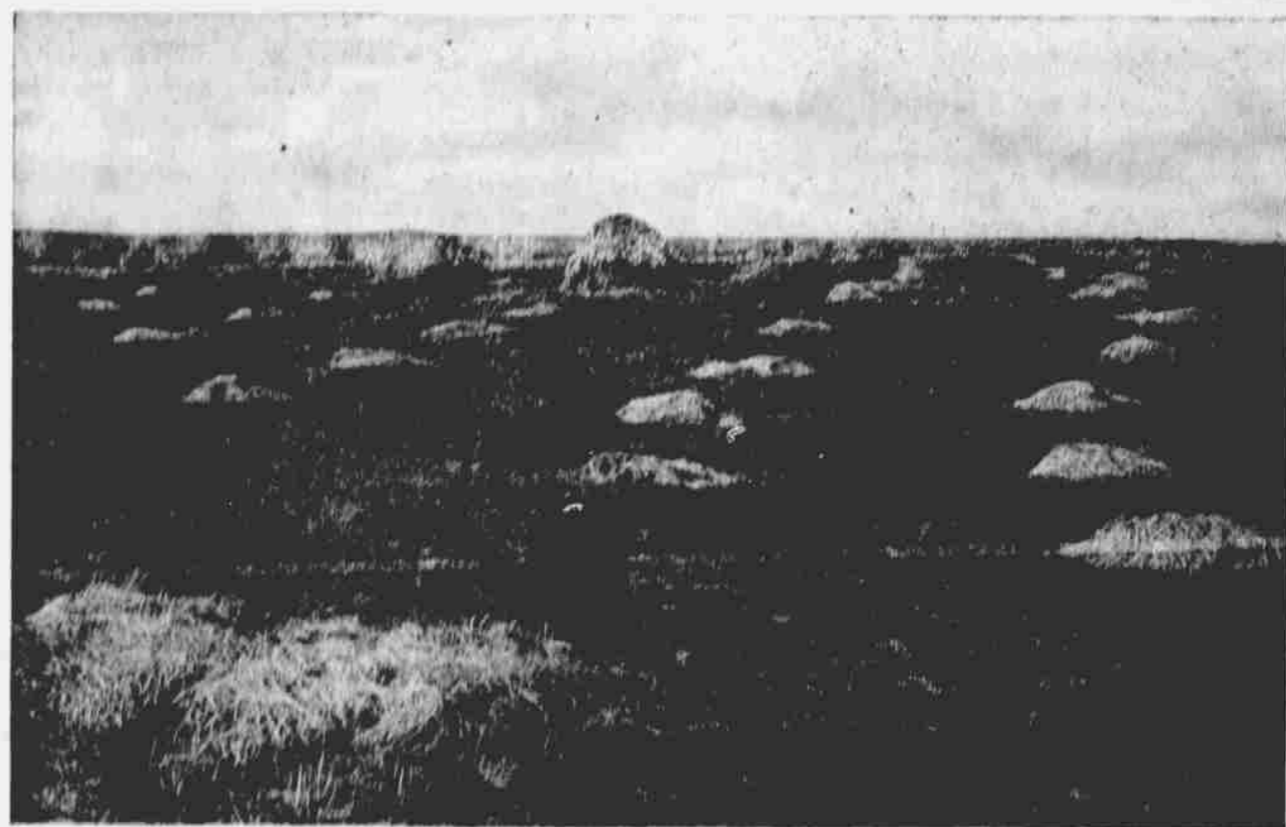
Alfalfa v údolí severní Platte řeky, vydává od čtyř do šesti tun po akru.