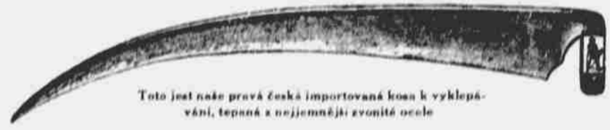
Toto jest naše pravá česká importovaná kosa k vyklepávání, tepaná a nejmenšími zvonitými oceli

Letos máme kosy z pravé štyřské ocele, pálené v dřevěném uhlí. Jsou to nejlepší kosy, jaké jsme kdy měli. Tento druh není nikde jinde k dostání, jenom u nás, ježto jsme uzavřeli smlouvu s dvěma největšími továrny v Rakousku a tyto kosy jsou hotoveny zvláště pro nás.