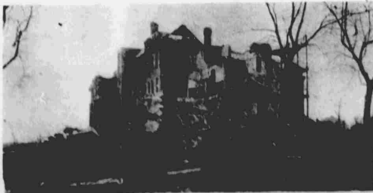
(Zapr.)Novo laskavosti čas. World Herald.)