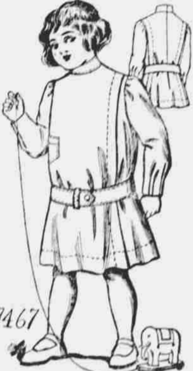
9467. Dětský oblek. — Stříhy ve 4 velikostech: 2, 4, 6 a 8 let. Jest třeba 2 3/4 yardů 44-palcové látky pro stáří 4 léta.

Každý, kdo sobě předplatí na některý z našich listů, obdrží jeden módní vzorek stříhů úplně zdarma. Další vzorky za 10c jeden.