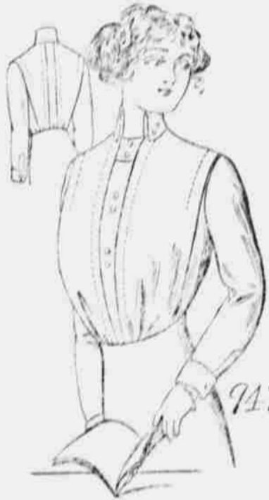
9474. Živůtek pro dámy s vestičkou. — Stříhy v 5 velikostech: 34, 36, 38, 40 a 42 palců přes prsa. Jest třeba 2 1/4 yardů 36-palcové látky pro velikost 36 palců.

Upozorňujeme naše odběratele, aby při objednávání vzorů kabátů stříhů neopomenuli udáti mimo naznačeného čísla ještě míru aneb stáří.