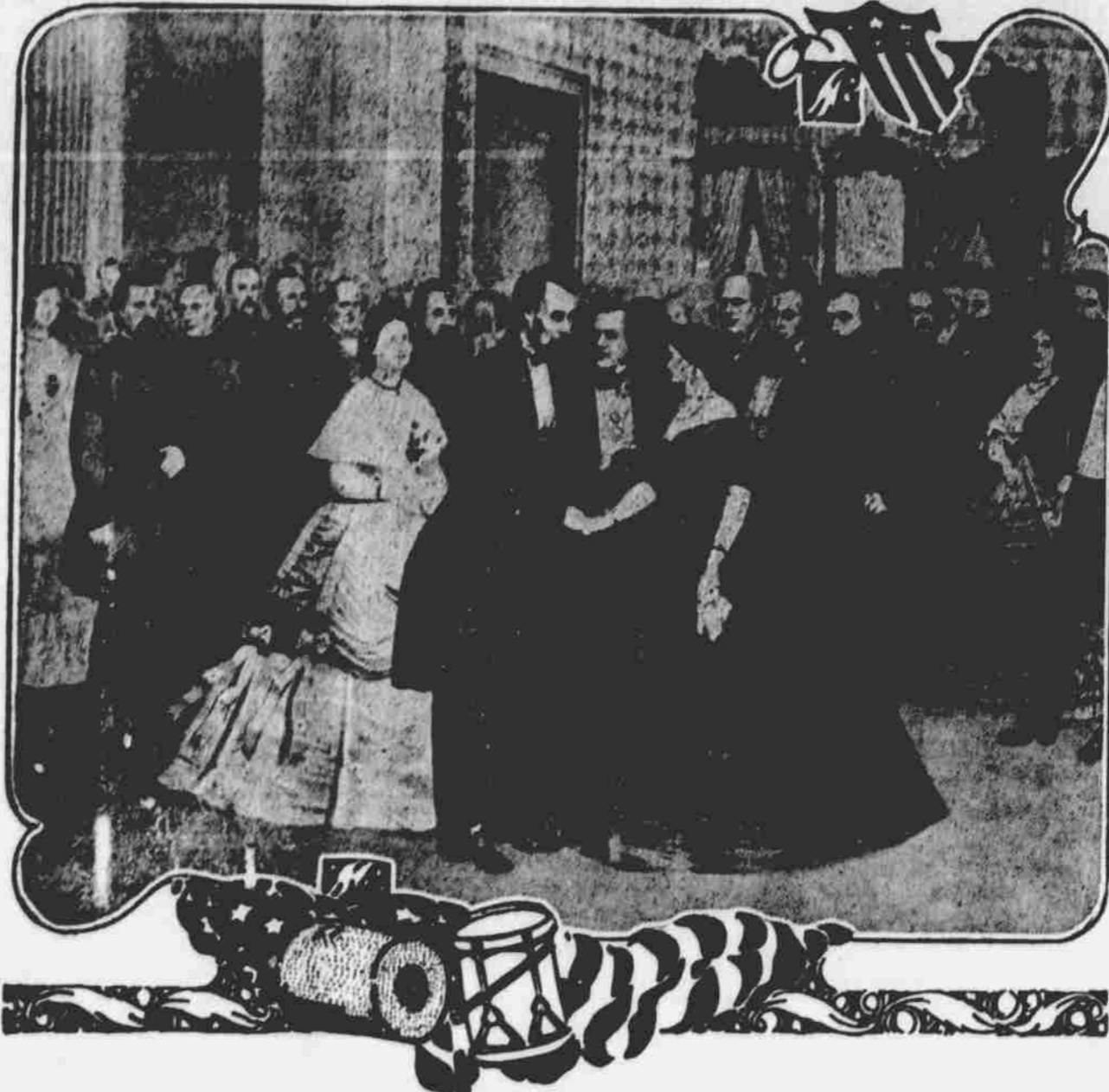
Ples při Lincolnově druhé inauguraci.

Toto byly snad nejtemnější dny, co Lincoln kdy poznal. Zodpovědnost za celou válku spočívala na něm, a to bylo skoro více, než mohl snést. Byl si vědom toho, že jednal správně, když propustil McClellana a osvolobil otroky, nicméně však bylo na ně-