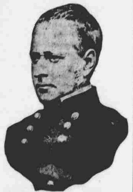
Gen. Joseph Hooker.

Před padesáti léty Lincoln dostal se ku své Valley Forge — skoro mohli bychom říci do své zahrady Gethsemanské. Čítal padesátýtyři roky věku a byl prezidentem něco méně než dva roky. Skoro po celý ten čas válka zúfala. Na západě štěstí celkem přálo zbraním Unie, avšak na východě, kde zápas musel být konečně rozhodnut, výsledek byl skoro opačný. Dvě nešťastné bitvy byly bojovány u Bull Run. McClellanova kampaň byla skoro nezdařena. Zmíněný generál sice poněkud napravil své chyby a vyhlídky pro Sever zjasnily se bitvou u Antietam, avšak jeho dlouhá nečinnost po oné bitvě donutila presidenta k ustanovení na jeho místa gen. Burnside-a.