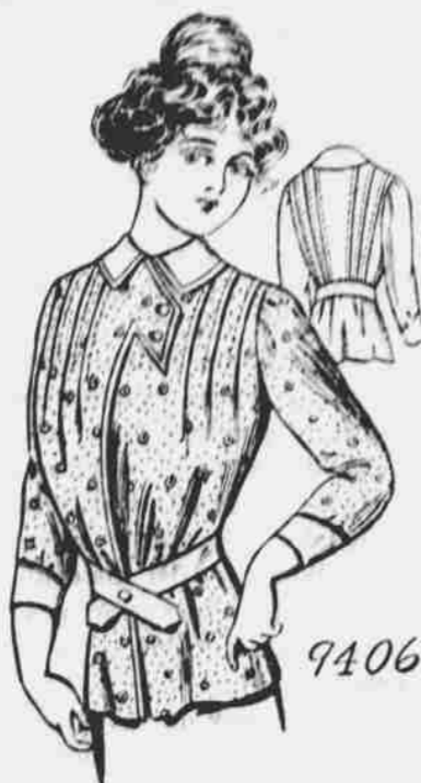
9406. Bluza pro dámy (Dressing Sack). — Střih v 6 mírách: 32, 34, 36, 38, 40 a 42 palečů míra v prsou. Jest třeba 3 yardy 44-palcové látky pro 38-palcovou velikost.