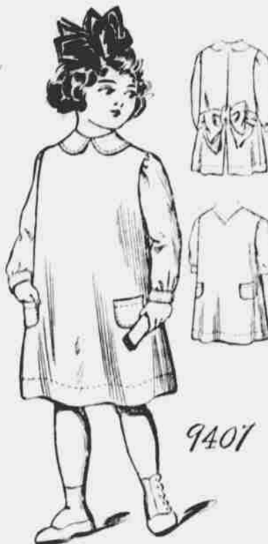
9407. Zástěrka pro dívky. — Střih v 5 mírách pro 2, 4, 6, 8 a 10leté. Jest třeba 3 1/2 yardu 27-palcové látky pro šestileté.

Každý, kdo sobě předplatí na některý z našich listů, obdrží jeden módní vzorek — střih úplně zdarma. Další vzorky za 10c jeden.