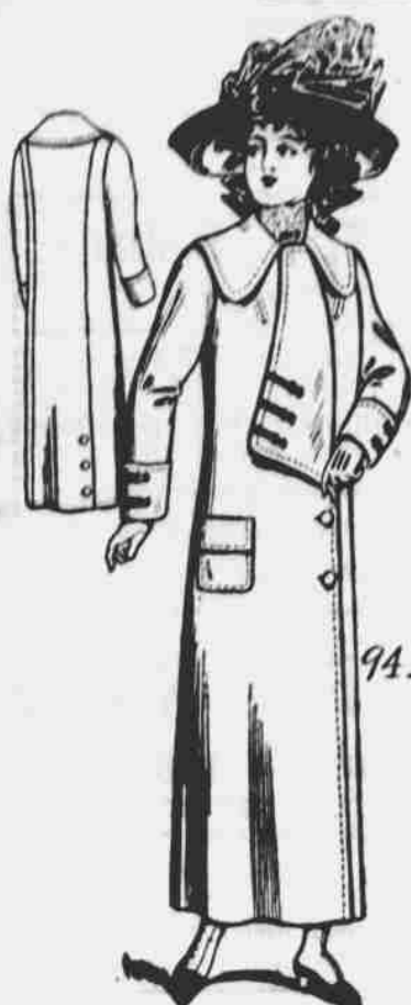
9412. Kabát pro děvčata a menší dámy. — Střih v 5 mírách: pro 14, 15, 16, 17 a 18leté. Jest třeba 3 1/2 yardu 50-palcové látky pro 15leté.