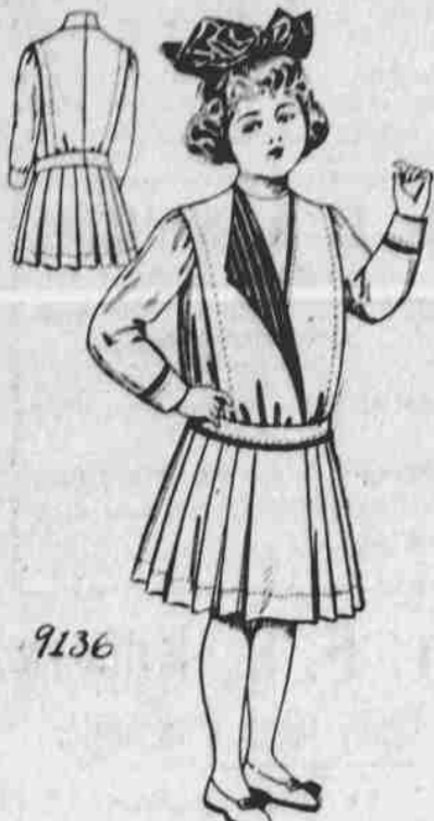
9136. Oblek pro děvčátka. — Střih ve čtyřech mířích pro 6, 8, 10 a 12leté. Jest třeba 3 1/4 yardů 44-palcové látky pro osmileté.