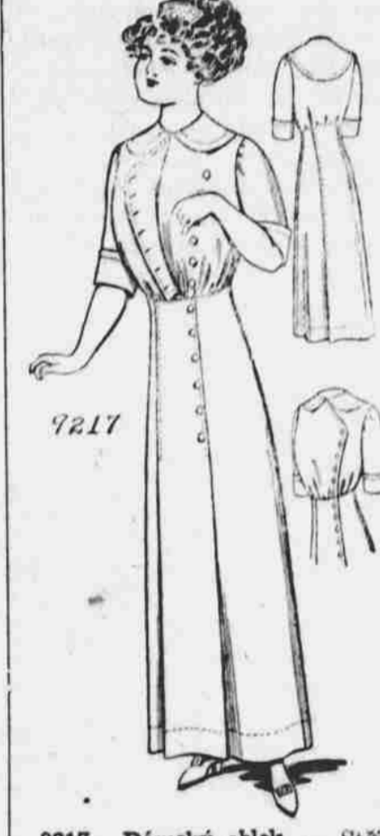
9217. Dámský oblek. — Střih v pěti mířích: 34, 36, 38, 40 a 42 palců míra v prsou. Jest třeba 5 1/2 yardů 40-palcové látky pro 36-palcovou velikost.

Každý, kdo sobě předplatí na některý z našich listů, obdrží jeden módní vzorek—střih úplně zdarma. Další vzorky za 10c jeden.