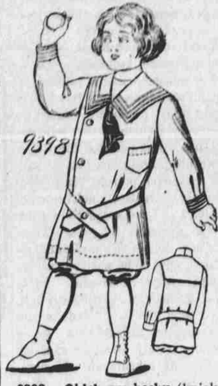
9398. Oblek pro hochy (knickerbockers). Střih ve 4 mířích pro 3, 4, 5 a 6leté. Jest třeba 3 1/4 yd. 44-palcové látky pro šestileté.